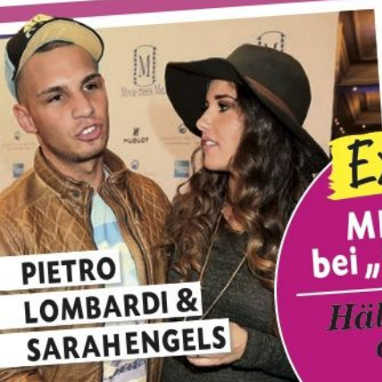
PIETRO LOMBARDI & SARAH ENGELS

DRAMA um Barbara Schöneberger Die Schock-Fotos