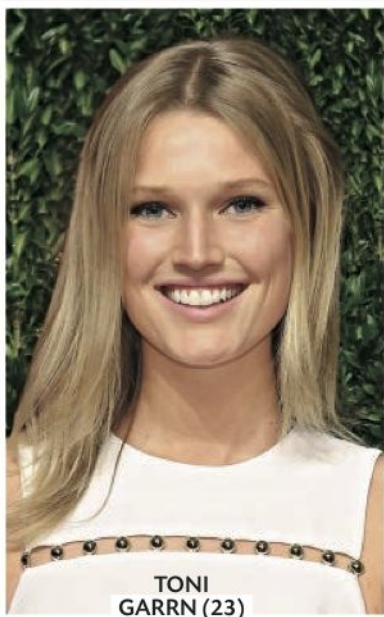
TONI GARRN (23)

Herrlich entspannt! Trotz ihres Erfolgs ist das Hamburger Topmodel auf dem Boden geblieben – wie ihre unkomplizierten Kosmetik-Favoriten beweisen.