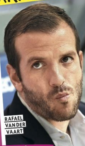
RAFAEL VANDER VAART